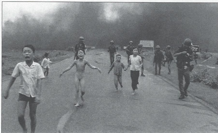
Tràng Bàng, Zuid-Vietnam, 8 juni 1972

Dit betekent ook dat foto's, kritisch geanalyseerd, toegang geven tot het ongeschreven discours, het historisch kader of de regelrechte ideologie die door hun gesedimenteerde interpretatie wordt ondersteund.