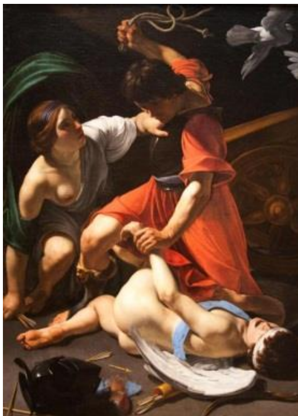
Bartolomeo Manfredi, Cupido gekastijd door Mars , ca 1610, Charles and Mary Worcester Collection, The Art Institute of Chicago.

Bartolomeo Manfredi, een schilder in de lijn van Carravaggio, zette rond 1605 een tafereel neer waarin een uitzinnig woedende Mars Eros aftuigt, en Venus er niet in slaagt haar zoontje voor de slagen van haar minnaar te behoeden. De interpretatie van dit schilderij is onzeker, al was het maar omdat het tafereel geen pendant heeft in de schat aan mythologische verhalen die vanuit de oudheid tot ons is gekomen. 20 Maar het is niet gek te stellen dat Mars’ woede zich hier keert tegen de grilligheid van Eros, de rede- en grondeloosheid van de manier waarop hij met zijn pijlen schiet, zowel met de gouden pijlen die iemand uitzinnig van liefde maken als de stompe pijlen die iemand afkeer van haar of zijn minnaar doet krijgen. Breiviks houding lijkt erg op die van Mars. Ook hij haat dit soort liefde en de oorlog waartoe hij Europa oproept is in laatste instantie tegen haar gericht.