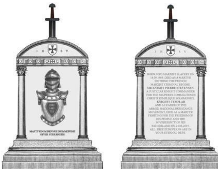
Voor- en achterzijde van een grafombe voor PCCTS martelaars, ontworpen door Breivik, Compendium p. 1098

oproept. Zijn individuele actie is slechts een manier om de andere cellen van het PCCTS wakker te schudden. In zijn hierboven aangehaald interview, verklaart Breivik dat hij lid is van die nieuwe Tempeliersorde, die in april 2002 in Londen zou gesticht zijn als een beweging die zich een kruisvaart tegen de islamitische Jihad tot doel stelt (p. 817). Van die internationale beweging beweert hij de Noorse éénmanscel te zijn.